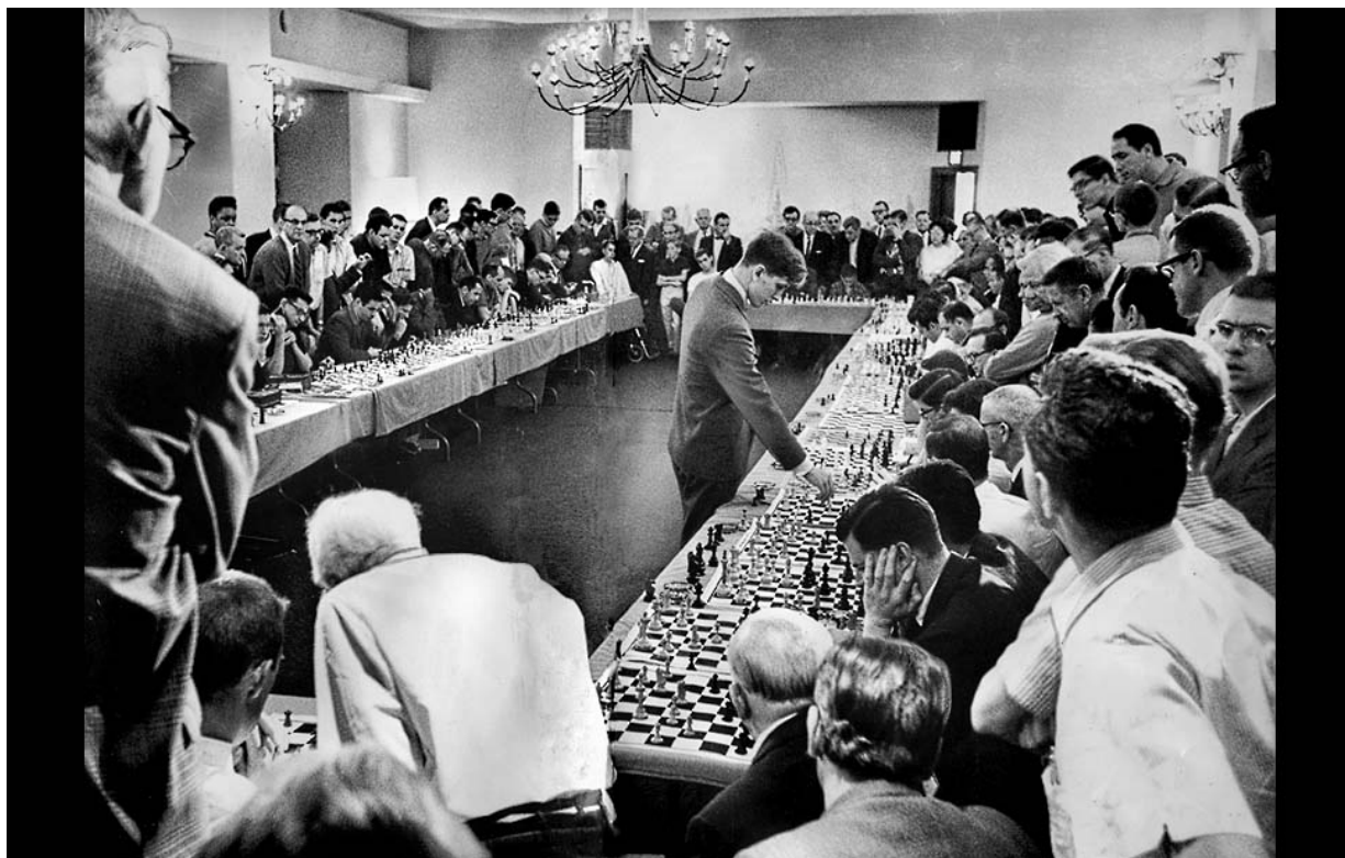
12. 4. 1964 – simultánka proti 50 soupeřům Hollywood