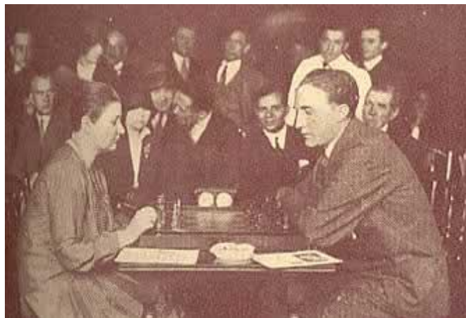
Вера Менчик - Марсель Дюшан Věra Menčíková – Marcel Duchamp

Věra Menčíková se narodila 16.února 1906. Velkou část života prožila ve své mateřské vlasti v Anglii, ale dětství bylo spojené s Ruskem. V devíti letech se Věra naučila hrát šachy a hrála se svým otcem, dokud v roce 1921 neemigrovala do Hastingsu – města, známého šachovými tradicemi. Samotná Věra považovala za svého učitele velmistra Gézu Maróczyho, který přijel do Anglie. Na cestě první mistryně světa se vyskytovalo nemále překážek, jako například, původ. Jelikož byla Češkou, neměla povolené hrát v ženském přeboru Anglie. Šachová „kvalifikace“ Věry Menčíkové probíhala na mužských turnajích, což jí také pomohlo zdokonalit své mistrovství.