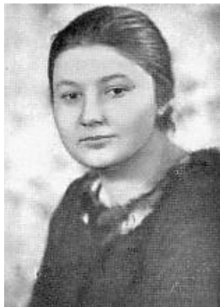
Вера Менчик - шахматная Мона Лиза Věra Menčíková – šachová Mona Lisa

První mistryně světa se stala také první ženou, připuštěnou do „vyššího světa“ mužské šachové veřejnosti. Hrál s ní pět mistrů světa – Lasker, Capablanca, Aljechin, Euwe, Botvinnik. Přičemž ve čtyřech partiích s holandským velmistrem Menčíková dosáhla velkolepého výsledku: dvě výhry a jedna porážka při jedné remíze. Celkem sehrála v mužských turnajích 487 partií, když 147 z nich vyhrála a stejné množství remizovala.