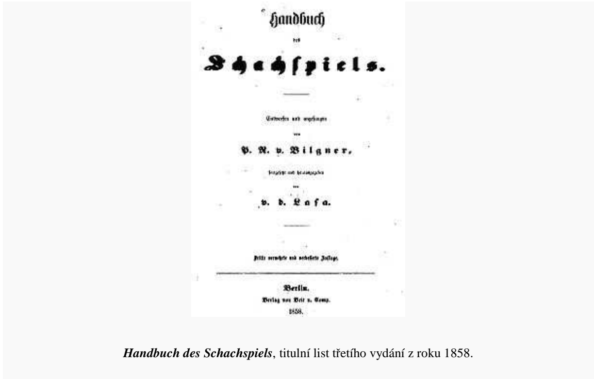
Handbuch des Schachspiels , titulní list třetího vydání z roku 1858.

Handbuch des Schachspiels (často jednoduše jen Handbuch , česky Příručka hry šachové ) je německá šachová kniha prvně vydaná roku 1843 baronem Tassilem von Heydebrandem und der Lasou. Kniha byla po mnoho desetiletí jednou z nejdůležitějších příruček šachové teorie, protože obsahovala kompletní rozbor všech do té doby známých šachových zahájení. Kromě toho v ní byly i pasáže o šachové historii a šachové literatuře.