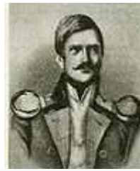
Paul Rudolf von Bilguer

Plejády nebo také Berlínské Plejády bylo jméno skupiny sedmi berlínských šachových mistrů, kteří se od roku 1837 scházeli dvakrát týdně v Berlínské šachové společnosti (Berliner Schachgesellschaft) k šachovým analýzám.